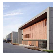
HOWEST - PIH KORTRIJK