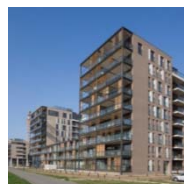
DE ZAAAT TEMSE