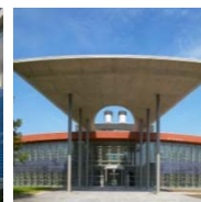
OPZ DAELWEZETH REKEM