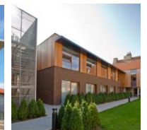
WZC O.L.V. VAN TROOST WESTKAPELLE