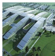
NAVO HQ EVERE