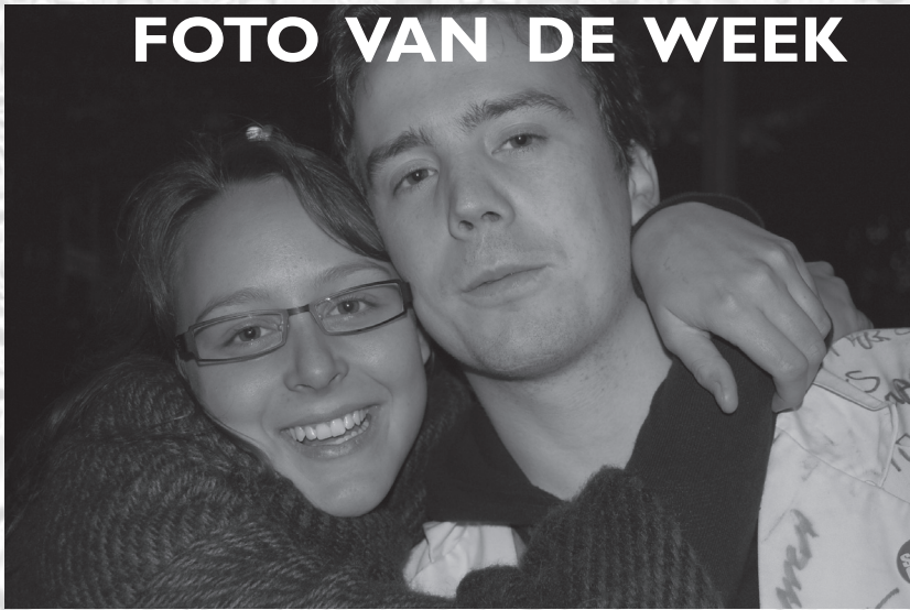
FOTO VAN DE WEEK