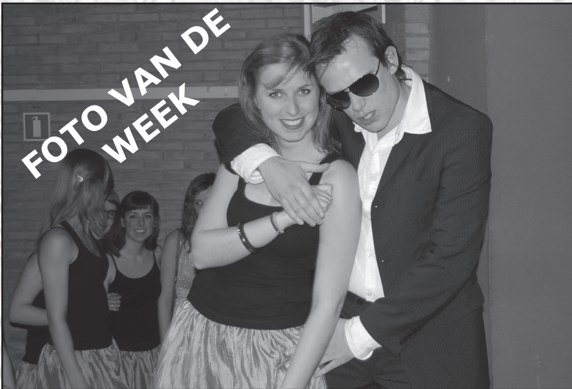
FOTO VAN DE WEEK