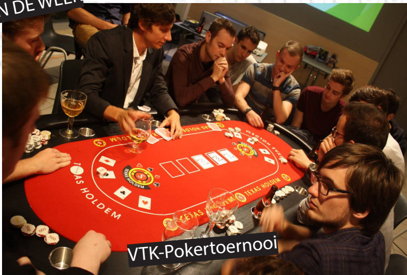
FOTO VAN DE WEEK