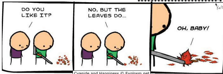
Cyanide and Happiness