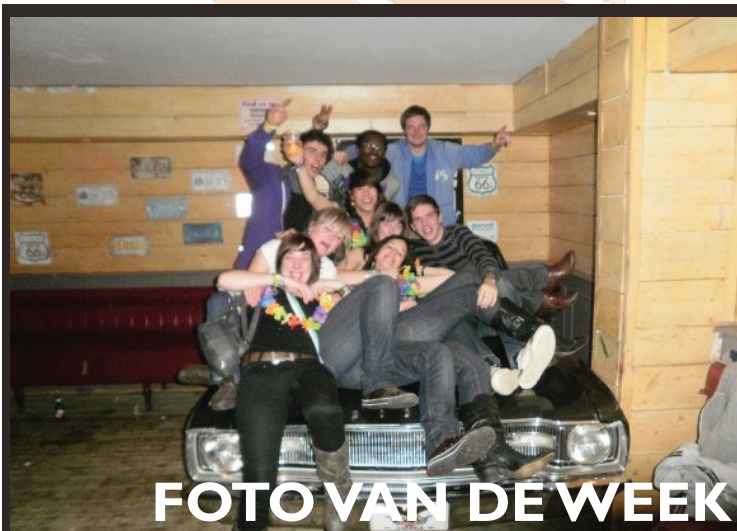
FOTO VAN DE WEEK

Ook in het tweede semester is de stripbib er terug! Heb je dus wat tijd over tijdens de middag tussen twee lessen door, kom dan zeker een kijkje nemen en maak een keuze uit ons gigantische aanbod aan exclusieve strips. De openingsuren voor dit semester zijn de dinsdag- en vrijdagmiddag van 13u tot 14u15, the place to be is nog steeds VTK Rood.