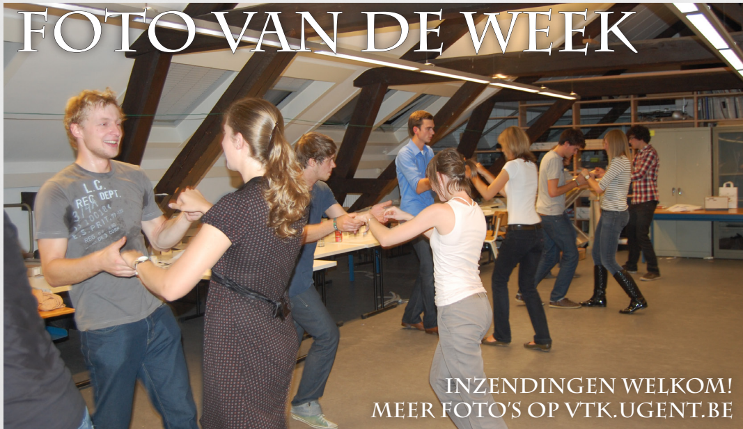
FOTO VAN DE WEEK

INZENDINGEN WELKOM! MEER FOTO'S OP VTK.UGENT.BE