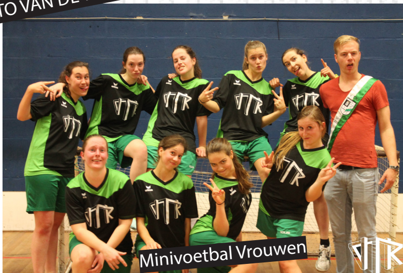
FOTO VAN DE WEEK