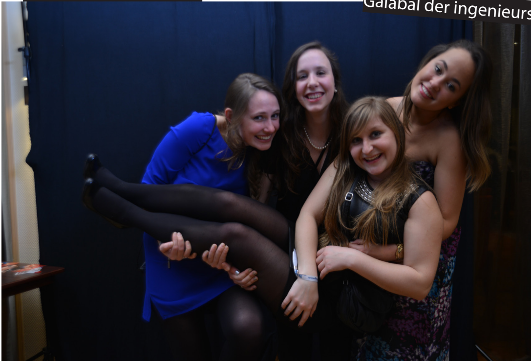
Galabal der ingenieurs