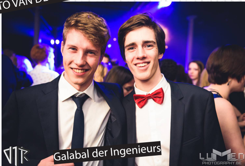
FOTO VAN DE WEEK