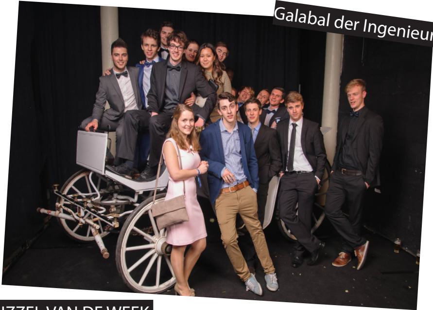
Galabal der Ingenieurs